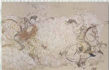
● 3. 胡人打馬球壁畫