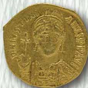
● 4. 東羅馬金幣