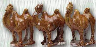
● 5. 三彩駱駝