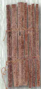
● 2. 康居王使者冊