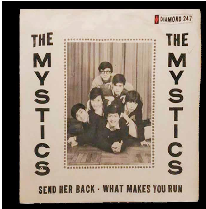
1967 年的單曲唱片 Send Her Back ，令神秘樂隊聲名鵲起。