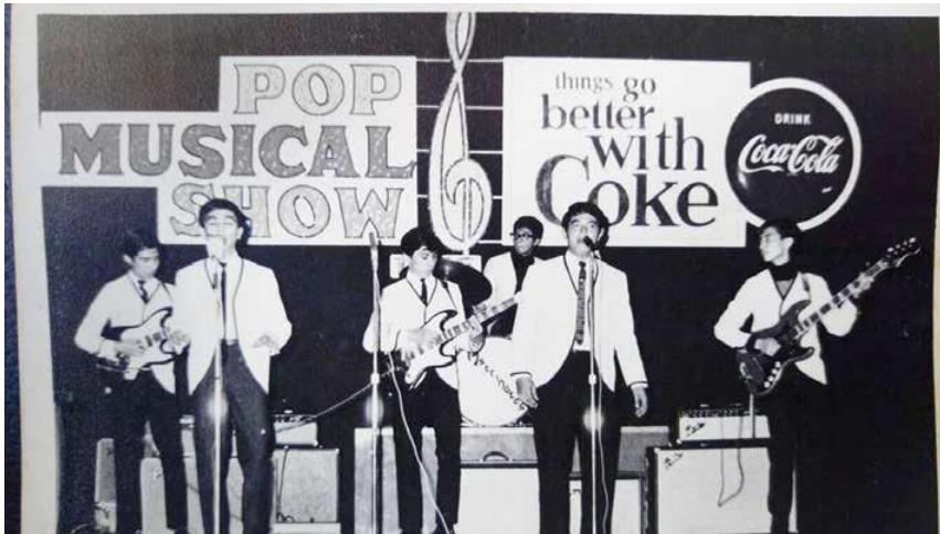
神秘樂隊在 Pop Musical Show 中的精彩演出。