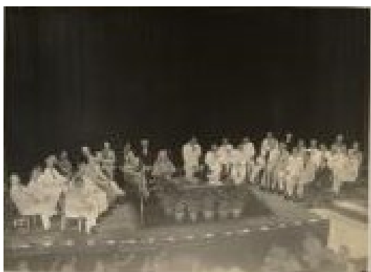
一九四一年九月十日楊慕琦在中環娛樂戲院宣誓就任港督。