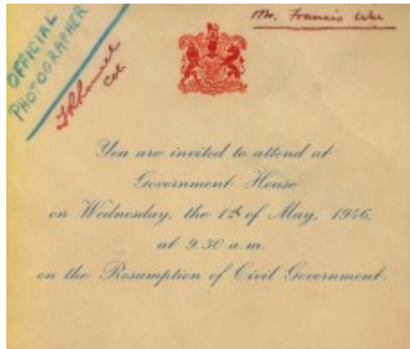
一九四六年五月一日在香港總督府(今禮賓府)舉行恢復民治政府典禮的邀請卡。