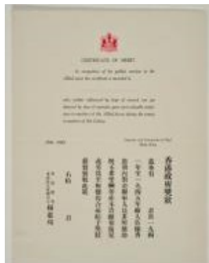
以港督楊慕琦的名義簽發的政府獎狀，頒予日佔香港時期對盟軍有功人士。