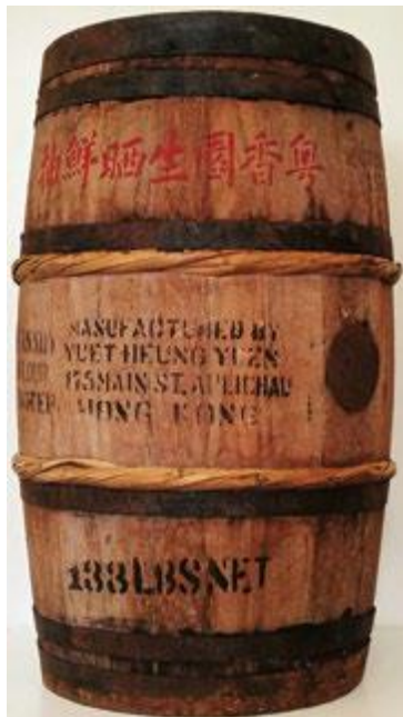
從香港運銷至美國的醬油桶