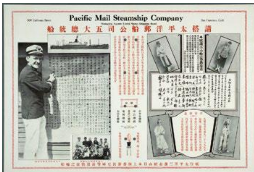
專營美國三藩市與香港航線的太平洋郵船公司廣告

鑑於香港在中國與海外之間的中轉地位，以及太平洋兩岸的人貨互動對香港及美國的歷史都十分重要，本館將從美國借來大批文物，細訴海外華僑與香港密不可分的關係。