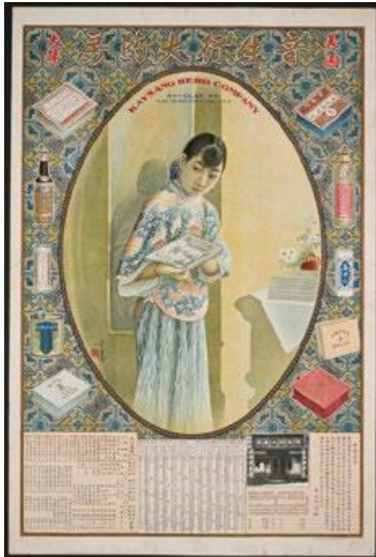
在香港設計及印刷的三藩市藥房月份牌