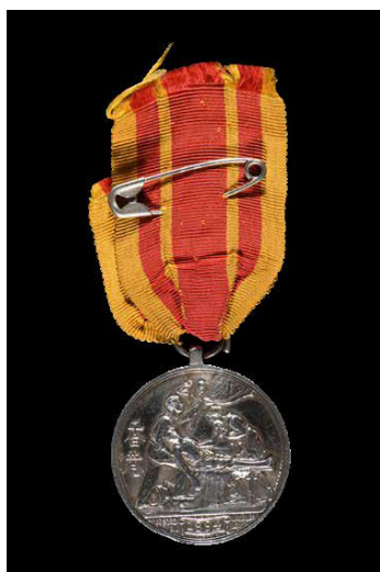
查普曼獲頒的香港瘟疫銀章