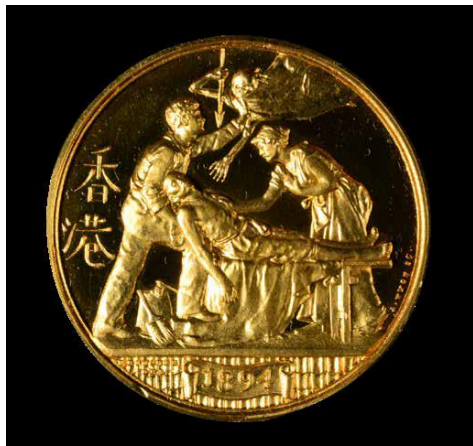
希堅獲頒的香港瘟疫金章