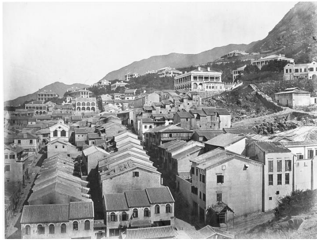
太平山區的華人密集民居，攝於 1870 年代。